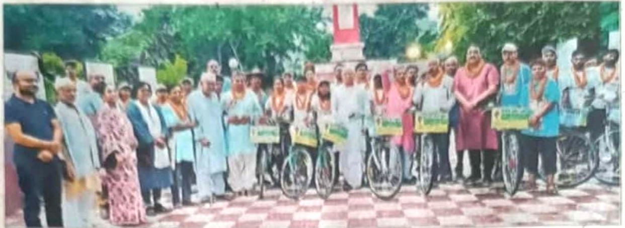
साइकिल यात्रा में शामिल युवक - युवतियां व अन्य.