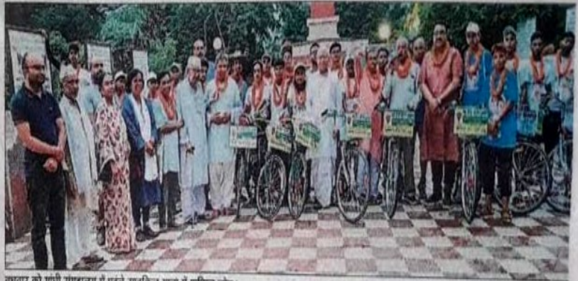
पुष्पार को गांधी संग्रहालय में पहुंचे साइकिल यात्रा में शामिल लोग।

समभाव प्रार्थना भाग लिया। यात्रा के सम्बंध में कार्यक्रम संयोजक अशोक भारत ने बताया कि 2 अक्टूबर गांधी जयंती के मौके पर बापू की कर्मभूमि पठितड़ावा आश्रम से पद्मश्री डॉ. एस.एन. सुब्बाराव उर्फ भाई जी की स्मृति में राष्ट्रीय युवा योजना के तत्वावधान में साइकिल यात्रा का शुभारंभ किया गया। जो 24 जिलों में जायेंगे। उन्होंने कहा कि इस 26 दिन की यात्रा में 1500 किलोमीटर की यात्रा तय की जाएगी। राष्ट्रीय युवा योजना के