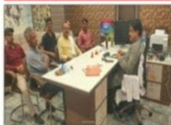
सामांत का बंटक सम्पन्न... (Caption text describing the meeting)

पुनः शुरू में परिचय के बाद... (Main text of the article)